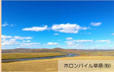
ホロンバイル草原(秋)