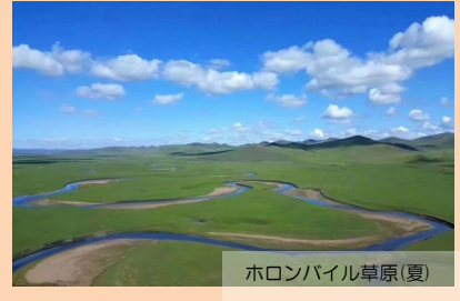
ホロンバイル草原(夏)